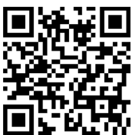
更多精彩内容, 可扫码浏览

* + Q > r G 2019 ' [ stc \ uvw \ xyz { h } 中 法 、 中 法大 以及 事法 中 法大 法 、 家 法 同 新中心共同 2019 事法 法 ( ) 3 22 3 24 在中 法大 平 . 杨 、 、 以及 生组成 代 表 , 荣获 . (法 杨 )